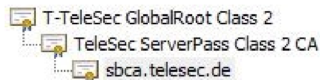
Abbildung 2: Übersicht der Zertifikathierarchie des Webservers „sbca.telesec.de“

In Abbildung 2 ist die Zertifikathierarchie des Web-Servers „sbca.telesec.de“ mit dem jeweiligen Zertifikat der Stammzertifizierungsstelle (Root-CA) und der Zwischenzertifizierungsstelle (Sub-CA) dargestellt.