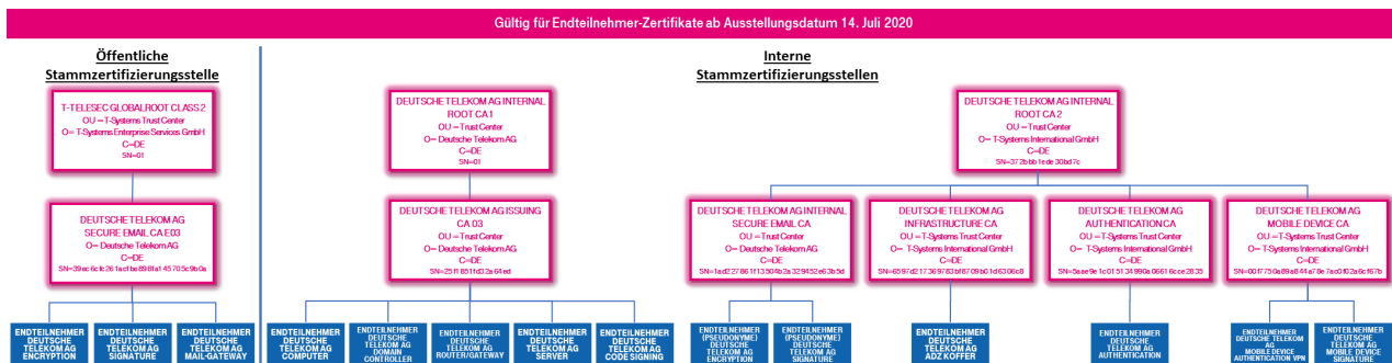
Abbildung 1: Übersicht des Root- und Sub-CAs ab Zertifikatsausstellungsdatum 14.07.2020

In Abbildung 1 ist die aktuell gültige Übersicht des PKI-Service „cPKI“ mit den Root- und Sub-CAs, aus denen Zertifikate ab Zertifikatsausstellungsdatum 14.07.2020 ausgestellt werden, grafisch dargestellt.