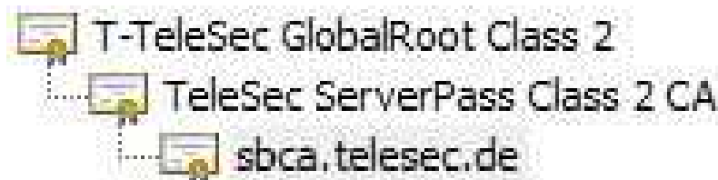
Abbildung 2: Übersicht der Zertifikathierarchie des Webserver „sbca.telesec.de“

In Abbildung 2 ist die Zertifikathierarchie des Web-Servers „sbca.telesec.de“ mit dem jeweiligen Zertifikat der Stammzertifizierungsstelle (Root-CA) und der Zwischenzertifizierungsstelle dargestellt.