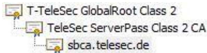
Abbildung 2: Übersicht der Zertifikathierarchie des Webservers „sbca.telesec.de“